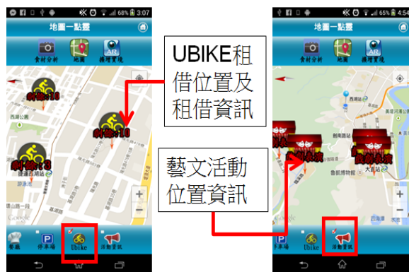
圖 3 附近 UBIKE 租借資訊、藝文活動資訊