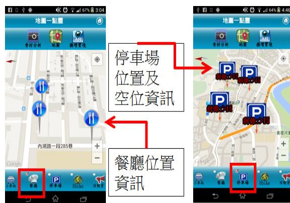
圖 4 附近停車位資訊、餐廳位置資訊