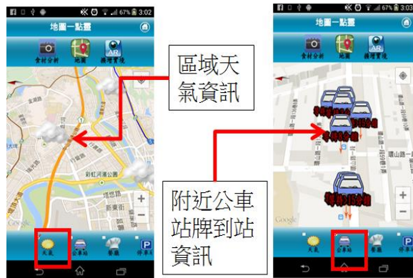
圖 2 附近公車站牌到站資訊、區域氣象資訊

3.首創以地圖為主的操控方式並搭配資訊視覺化的地標圖示來直接顯示資訊內容或表達訊息,另外搭配 AR 擴增實境的技術直接透過手機鏡頭將附近資訊呈現在真實世界中。使用者只要將手機鏡頭對著附近環繞一圈,手機就能立刻顯示附近公車站牌到站資訊、區域氣象資訊、停車位資訊、UBIKE 租借資訊、餐廳位置資訊、藝文活動資訊等,讓您體驗虛擬又真實的專屬適地性服務。